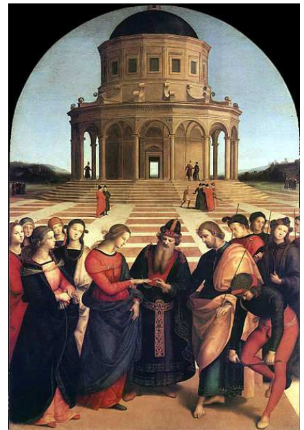
Rafael. Los Desposorios de la Virgen. 1504. Pinacoteca Brera. Milán.